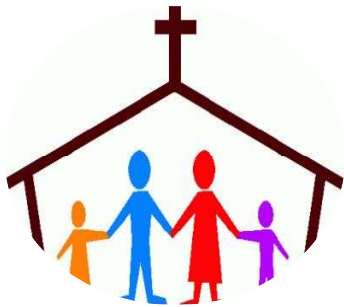
FAMIGLIE E GRUPPI PARROCCHIALI