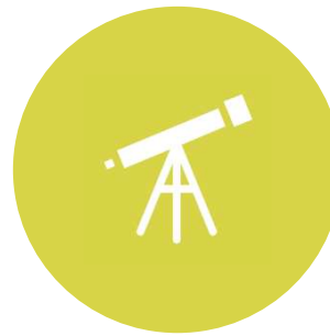
SCUOLE E INSEGNANTI DI RELIGIONE