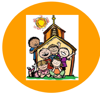
GRUPPI DI CATECHISMO E INIZIAZIONE CRISTIANA